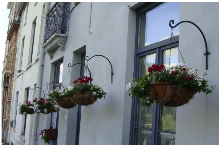
Contenants suspendus au-dessus de l'espace public