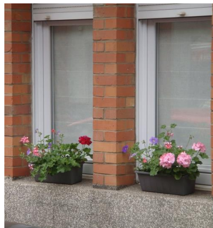
Contenants posés sur les seuils des fenêtres et non retenus par un support