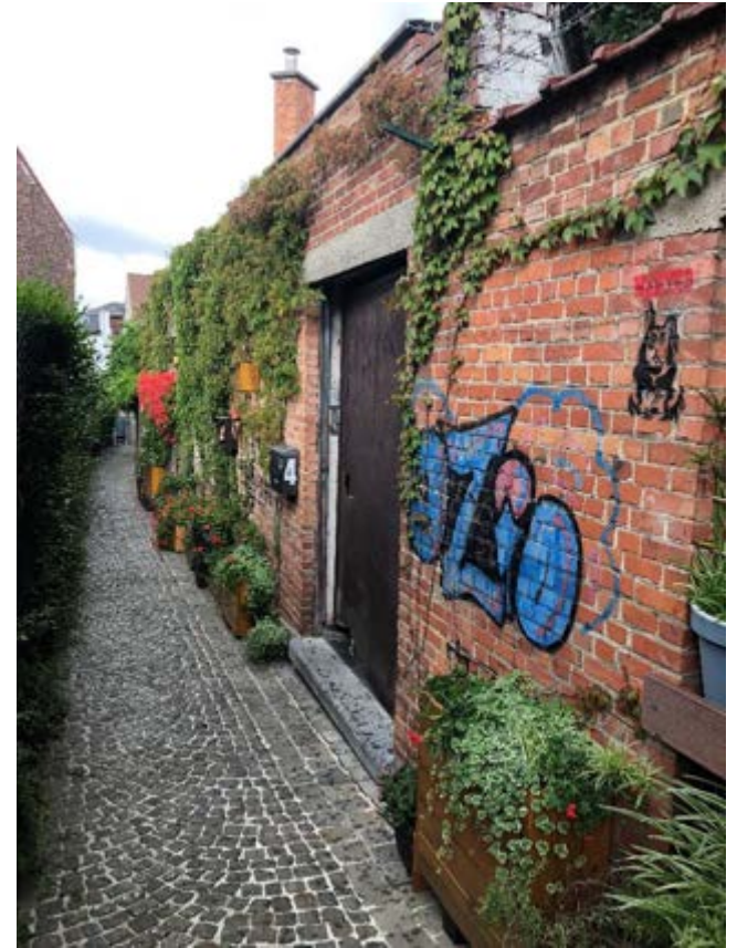
4 chemin des Roses