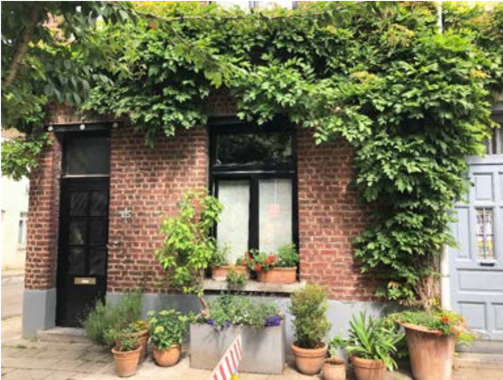
105 rue du Coq