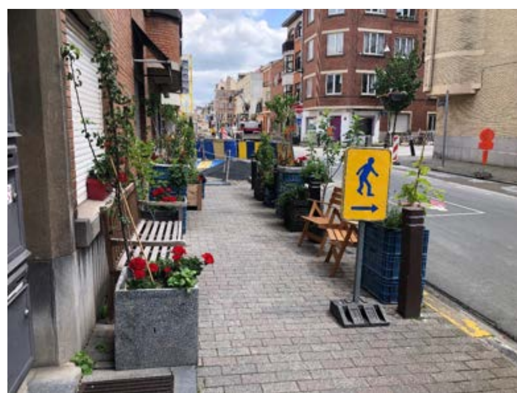
33 rue Général Lotz