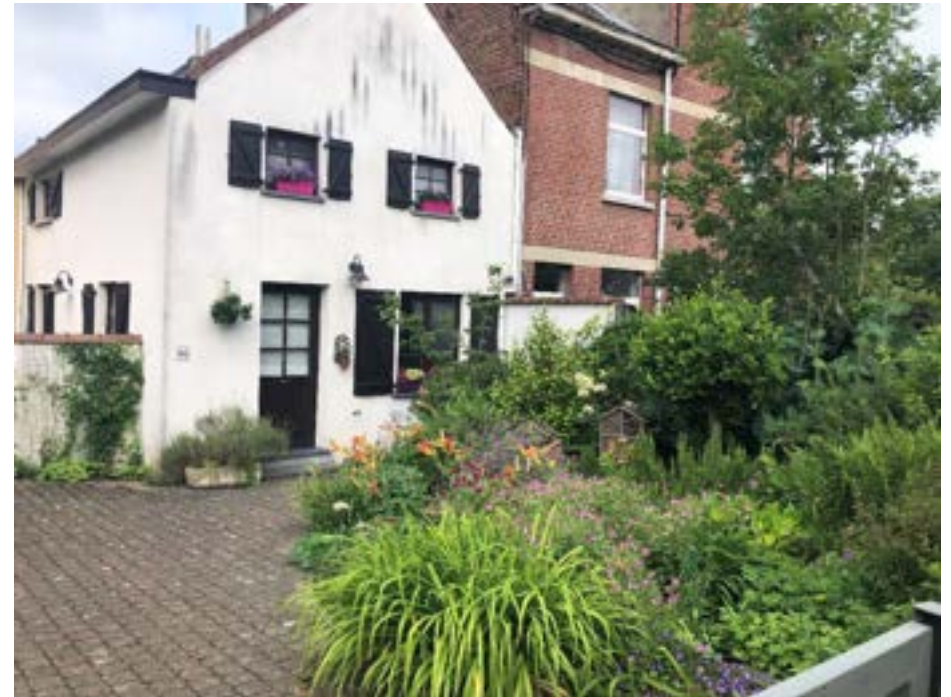
92 chée de Drogenbos