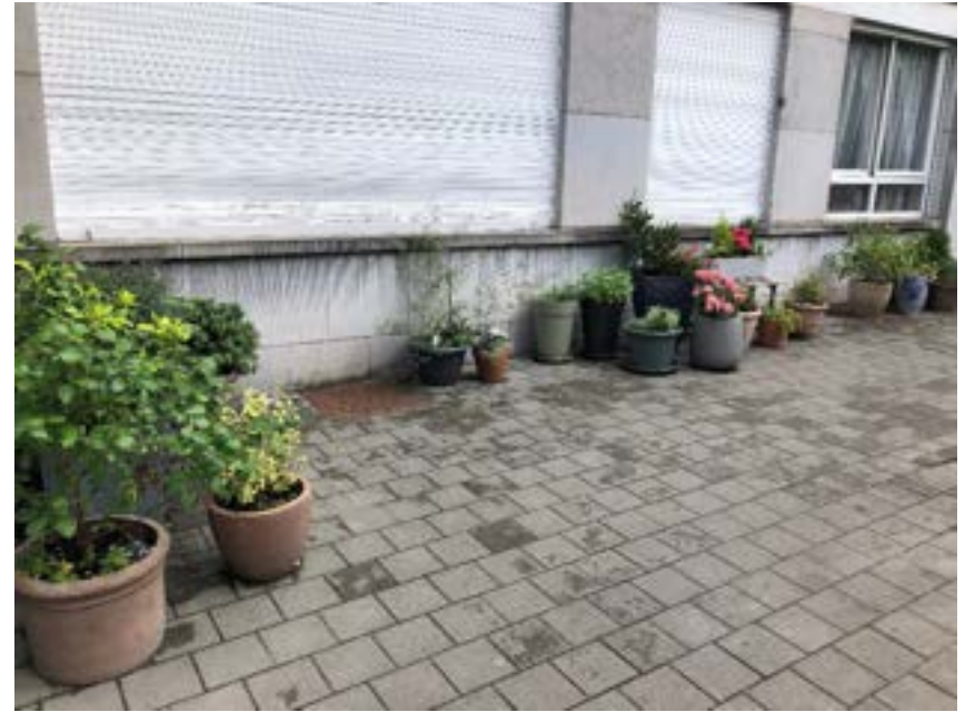
936 chée d'Alseberg