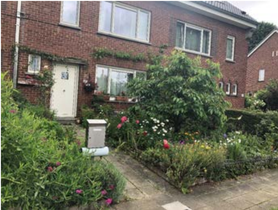
27, avenue des Sophoras