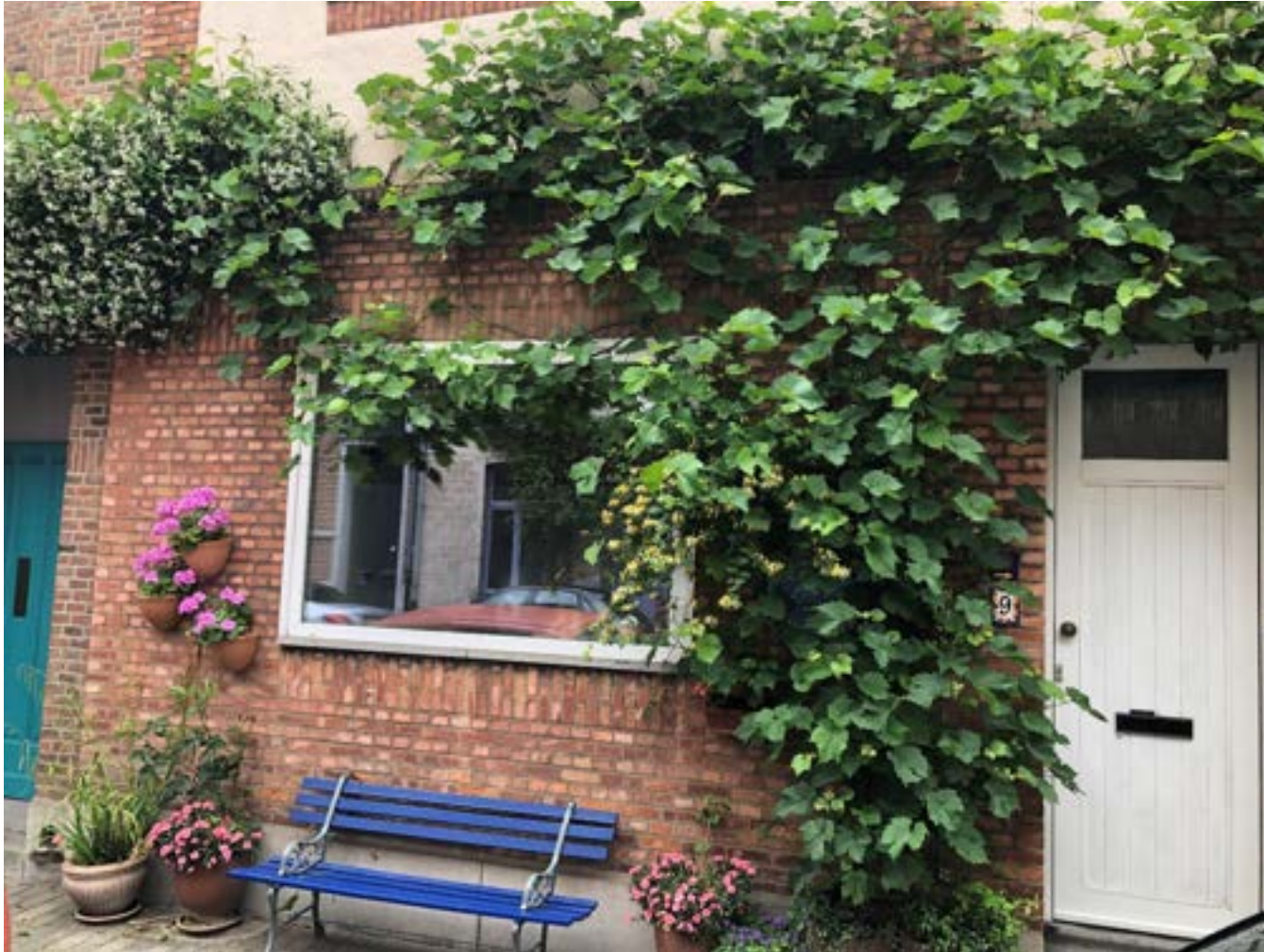
9 rue Beeckman