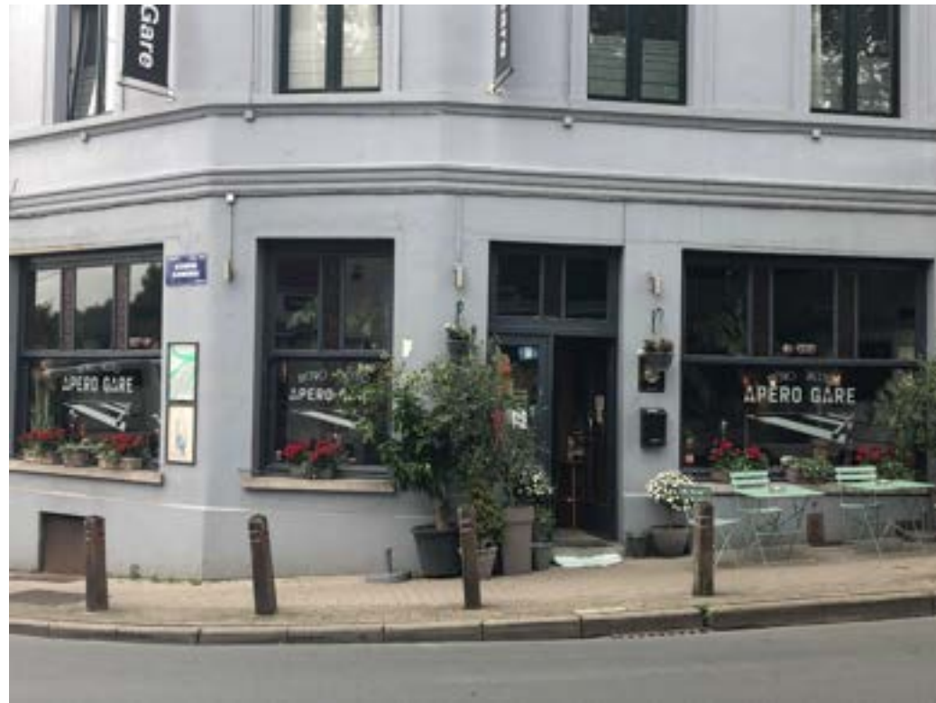
2 rue Egide Van Ophem