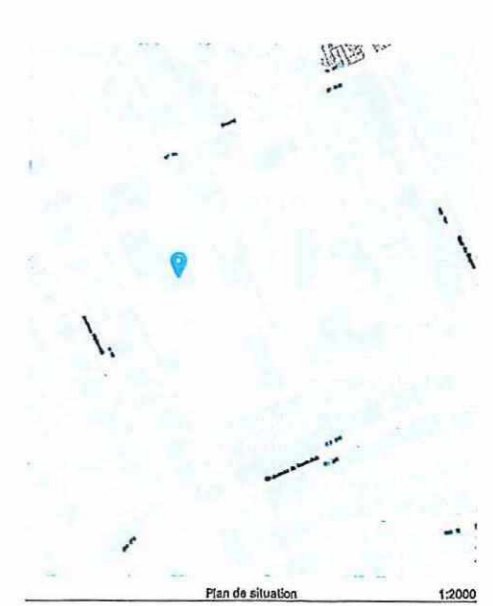
Plan de situation 1:2000