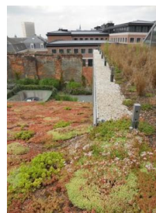
Bruxelles, Faubourg d'Egmont sprl Réalisation : Landscapedesign