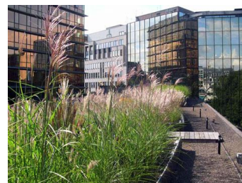
Bruxelles, Commission européenne Réalisation : Landscapedesign