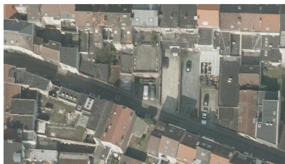
Zone du centre d'Uccle vue du ciel en 2012