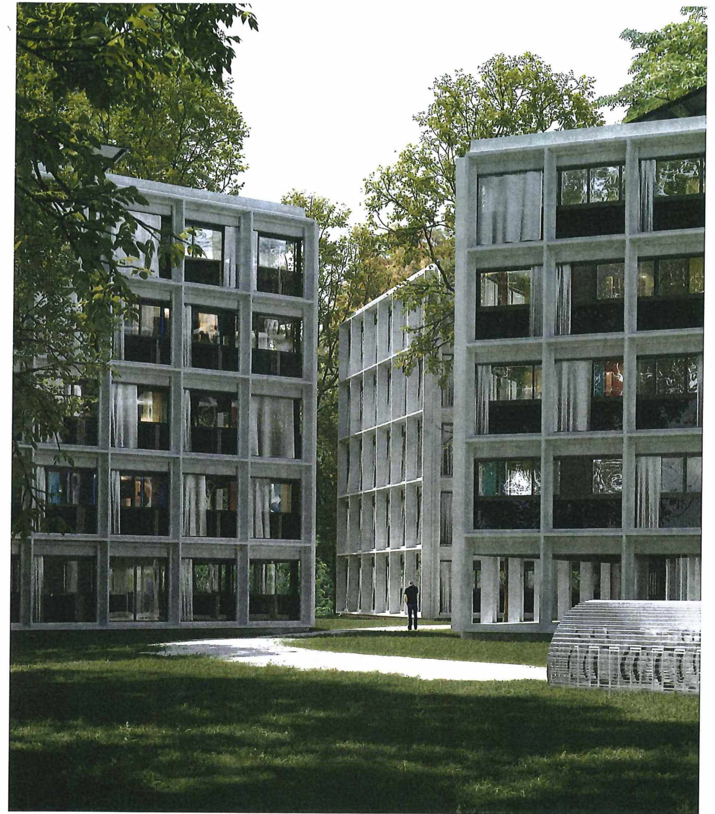
Perspective en intérieur d'îlot (P2)